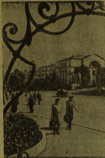
ПО ГОРОДАМ СОВЕТСКОГО СОЮЗА